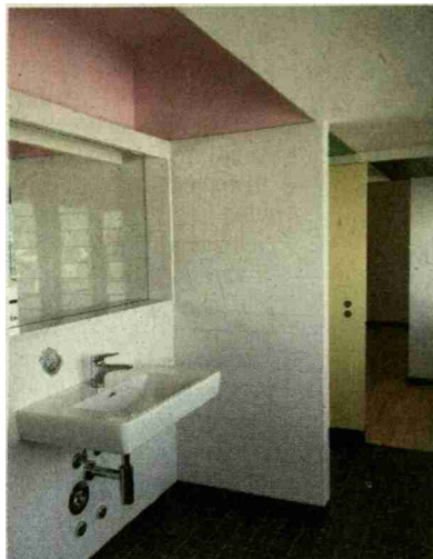
Typisch für James in Albisrieden: farbige Wände und Decken in den Badezimmern, bunte Balkonunterseiten.

«Es sind kleine Sachen, die das Leben vereinfachen und den Mietern mehr Freizeit bringen.»