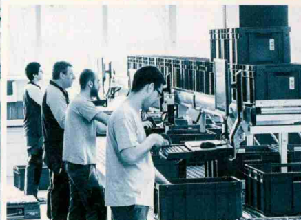
2 ZFV-UNTERNEHMUNGEN Die Genossenschaft bietet gratis Mitarbeiterweiterbildungen. 3 MÖBEL PFISTER Der Einrichtungsspezialist hört auf Verbesserungsvorschläge seiner Leute.

1 ISS SCHWEIZ Der Gebäudedienstleister legt Wert auf die Wertschätzung der eigenen Leute, etwa durch interne Auszeichnungen. Das ist im Dienstleistungssektor besonders wichtig, denn dort gibt es kein fertiges Produkt, auf das die Mitarbeiter stolz sein können.