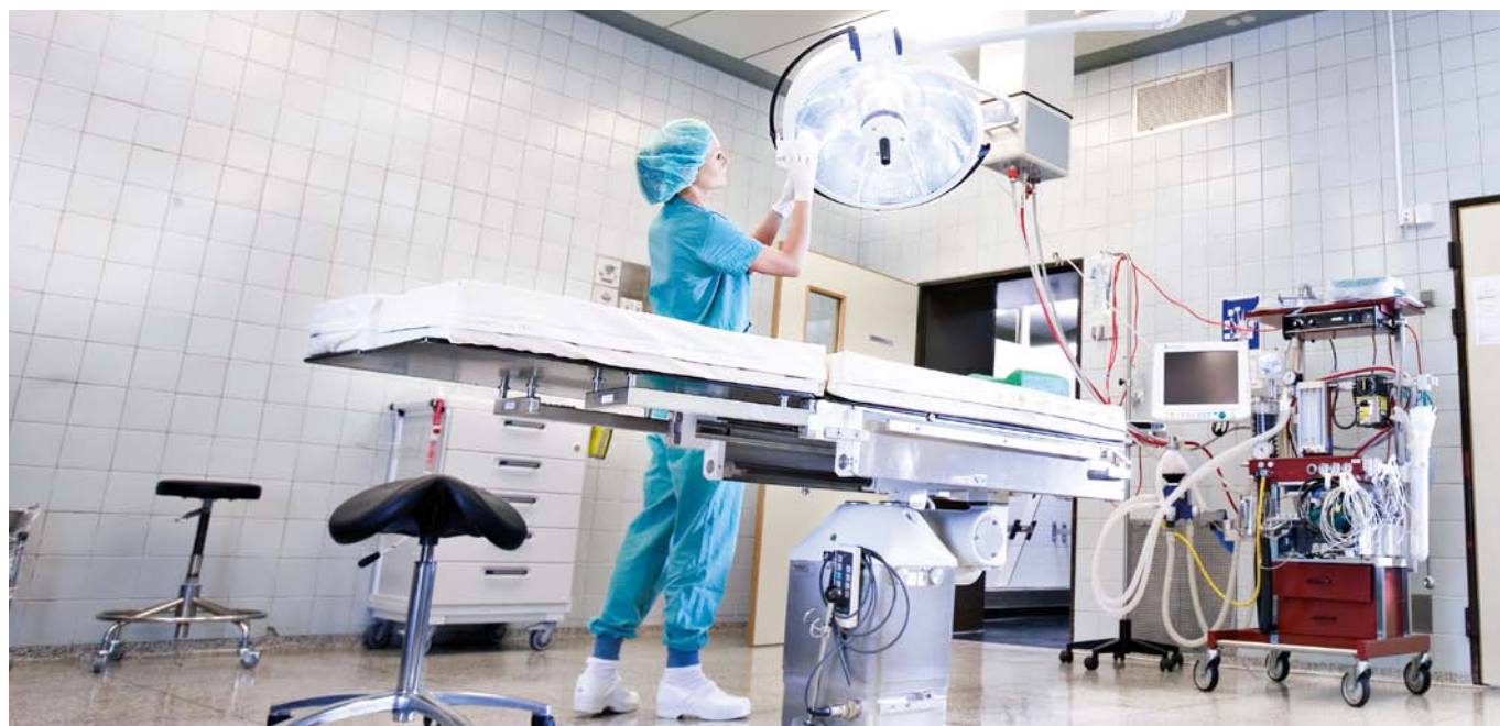
Le nettoyage dans les domaines hautement sensibles, ici une salle d'opération, requiert un savoir-faire spécial.

«Avec la pression croissante sur les prix, l'attrait des solutions nouvelles et innovatrices augmente également.» Rolf Biesser