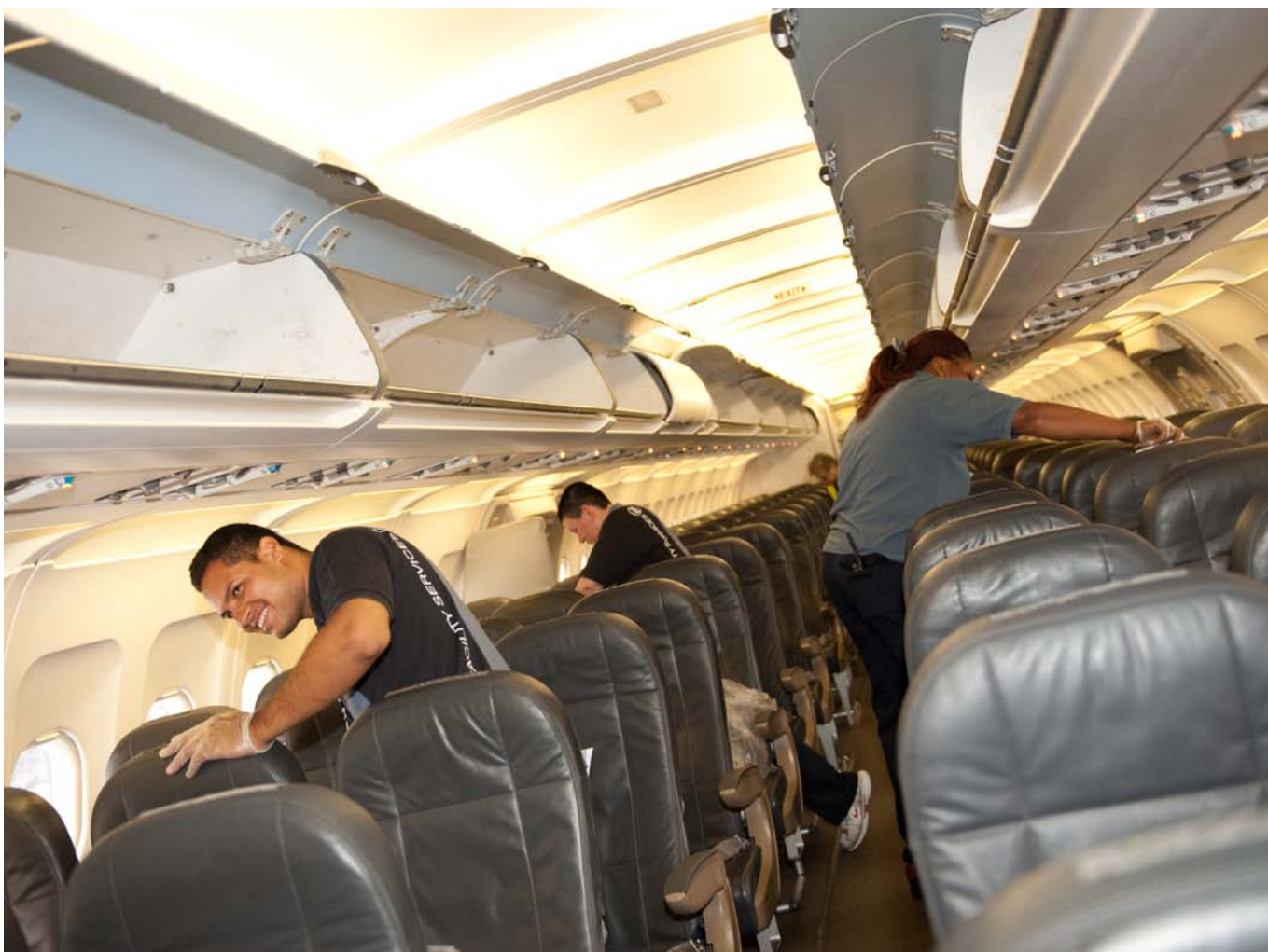
Pour le nettoyage d'un avion court-courrier, les collaborateurs d'ISS disposent d'à peine dix minutes.